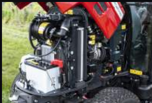
Zúžená kapota a design přední nápravy zaručují pohodlný přístup k motoru.

Všechno, co nabízíme, prošlo kontrolou našich mechaniků ze všech úhlů - optimální slučitelnost s vaším strojem, bezpečnost, odolnost i výkonnost. Váš prodejce Massey Ferguson vám zajistí odborný servis, jelikož má při ruce všechny nezbytné nástroje a znalosti pro instalaci.