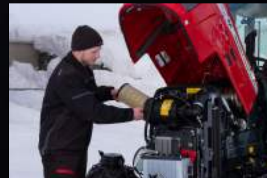
Uměřená chladicí soustava je snadno přístupná a usnadňuje čištění i údržbu. Vzduchový filtr motoru je také velmi snadno přístupný a snadno se čistí.