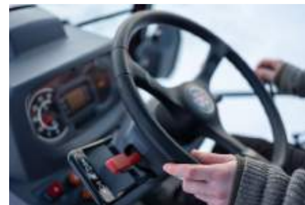
Mechanická převodovka s reverzační pákou Power Shuttle u model MF 1700 M-12Fx12R pro maximální pohodlí při každé činnosti.