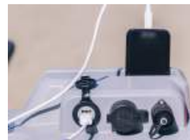
PODPORA TELEFONU se 2 porty USB a zásuvkou 12 V