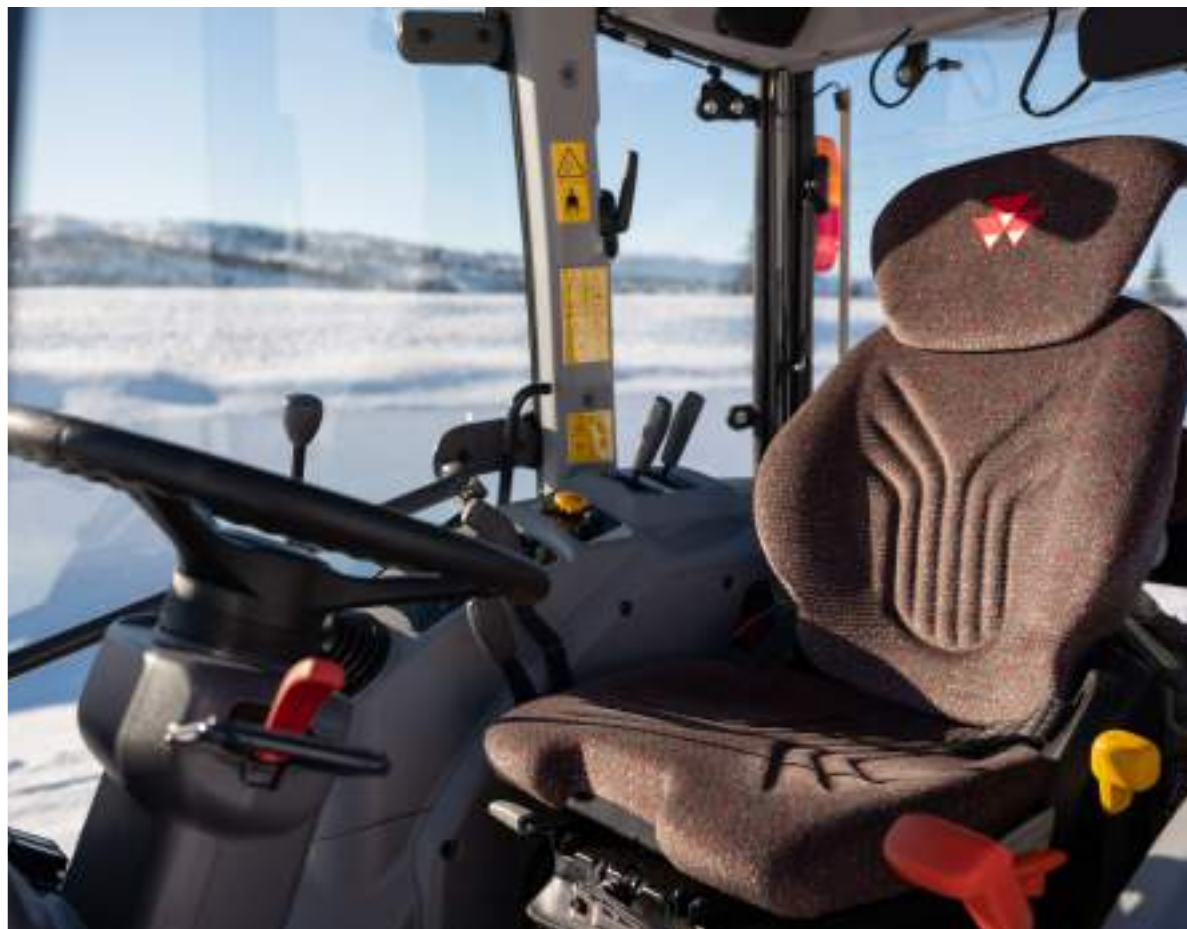
POHODLNÉ PRACOVÍŠTĚ PRO SNAŽŠÍ DEN K dispozici volitelné pneumatically odpružené sedadlo