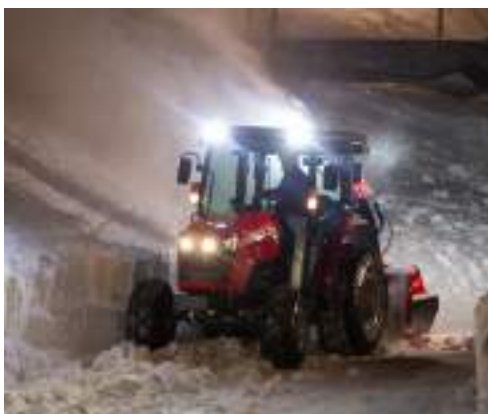
4 PROVOZNÍ SVĚTLA LED - dvě vpředu a dvě vzadu

OBČAS I DROBNÉ DETAILY ZNAMENAJÍ OBROVSKOU ZMĚNU VAŠÍ PRACOVNÍ ZÁTĚŽE.