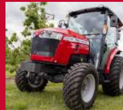
PNEUMATIKY PRO SMÍŠENÉ SLUŽBY