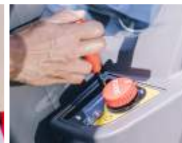
Prakticky umístěná páka ručního ovládání plynu