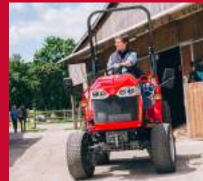
PNEUMATIKY NA HŘIŠTĚ