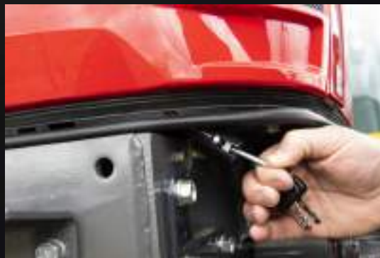
Snadné otevírání kapoty.

Propojili jsme praktičnost se stylem, abychom zajistili rychlou, přímou a jednoduchou údržbu, kdy vás zbavíme stresu z údržby traktoru a můžete dříve vyrazit zpět na pole, získáte tak vyšší produktivitu a více volného času. Díky traktoru Massey Ferguson řady MF 1500 a MF 1700 M je čas strávený na dvoře při přípravě na nadcházející den omezený na minimum.