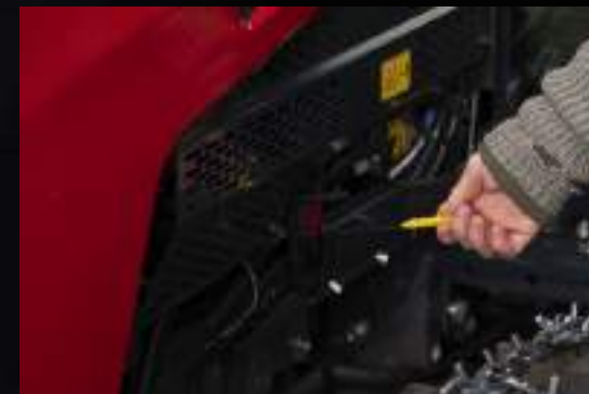
Jednoduchý a rychlý přístup pro běžnou údržbu.