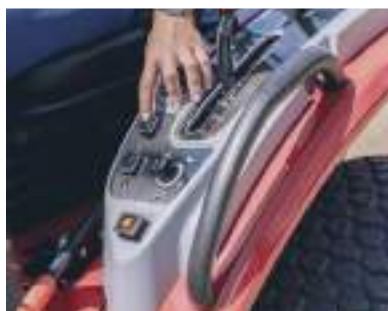
Snadné ovládání pomocí tempomatu

Model MF 1525 používá dvupedálové ovládání, kdy jeden pedál ovládá směr jízdy a umožňuje bezspojkovou jízdu pro vyšší pohodlí.